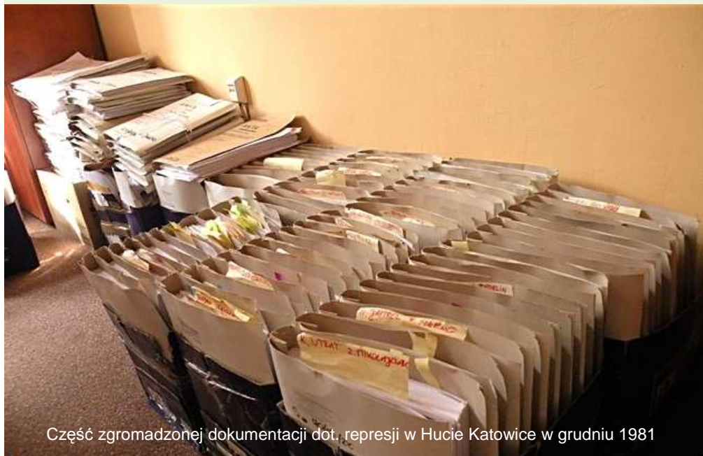
Część zgromadzonej dokumentacji dot. represji w Hucie Katowice w grudniu 1981

Oddziałowa Komisja Ścigania Zbrodni przeciwko Narodowi Polskiemu Instytutu Pamięi Narodowej w Katowicach, bliska jest zakończenia śledztwa w sprawie przekroczenia uprawnień przez funkcjonariuszy SB, MO i ZOMO w grudniu 1981 roku w Hucie Katowice.